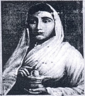
देवी अहिल्याबाई होलकर